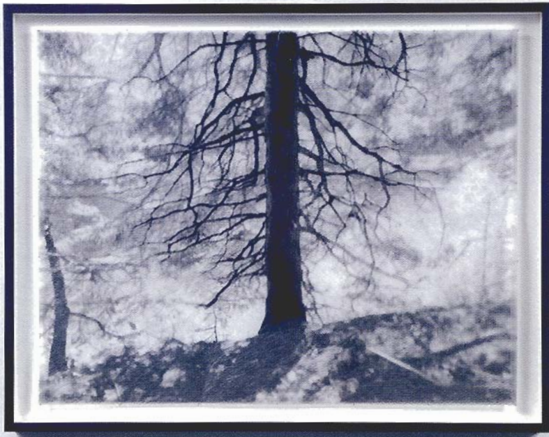
Roberto Pellegrinuzzi, Arbre, Domaine de Gaspé , 2006. 92 x 116 x 7,5 cm. Photographie sur papier Japon, acrylique, épingles, édition de 3.

l'impression qui se dégage plastiquement de l'examen de ces travaux. L'accumulation qui en vient à faire image se fait donc dans cette superposition densifiée, d'un voile à l'autre, tendu depuis les tréfonds.